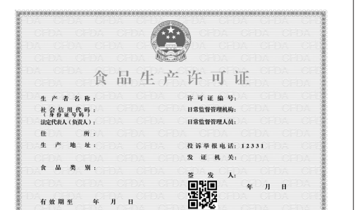
新版《食品生产许可证》正本式样