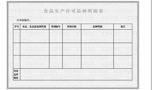
新版《食品生产许可证》副本明细表式样