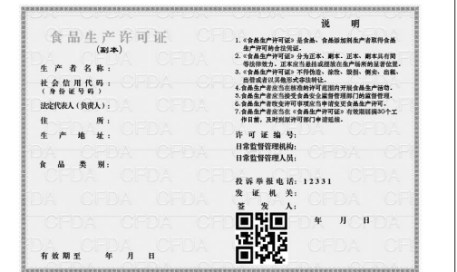
新版《食品生产许可证》副本式样